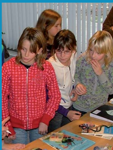
Bron: Horst ald Maas In'Zicht 2008, E, til b.v.