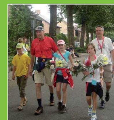
Op 14, 15 en 16 augustus vond de Melderslose kennedymars MKM plaats. Zo'n 77 personen liepen mee, inclusief burgemeesters en pastoors. Naast de 80, 40, 25 en 10 km wandeltochten organiseerde +evenementen ook twee fietstochten van 40 en 70 km.

Ook voor 2010 staan nog diverse evenementen op de rol. Bijvoorbeeld een gezamenlijke uitvoering van muziekgezelschappen uit de nieuwe gemeente, een groot korenevenement (24 mei 2010), een voetbaltoernooi, een gemeentelijke zeskamp, een festival met plaatselijke bands en een expositie in Museum de Kantfabriek. Daarnaast worden begin 2010 een speciale postzegel en een smaakmand met diverse producten uit de nieuwe gemeente gepresenteerd.